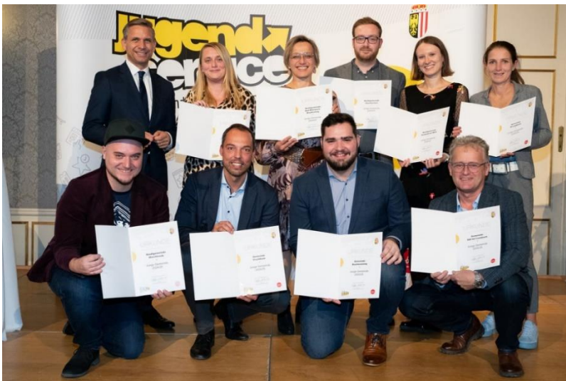
Foto: Verleihung Junge Gemeinde