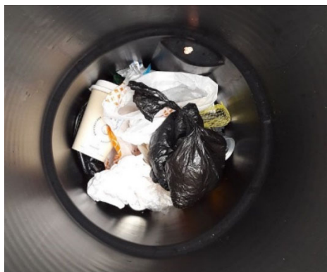
richtig gelandet: Hundekotbeutel im Restabfallbehälter

Für weitere Fragen stehen die AbfallberaterInnen am Misttelefon 07242/54060 gerne zur Verfügung.